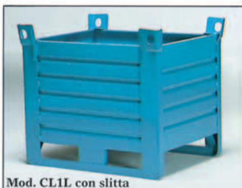
Mod. CL1L con slitta