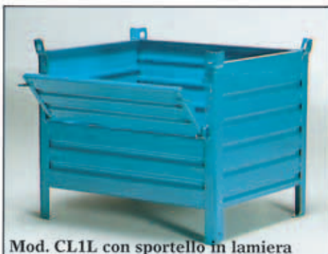
Mod. CL1L con sportello in lamiera