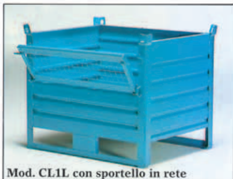
Mod. CL1L con sportello in rete