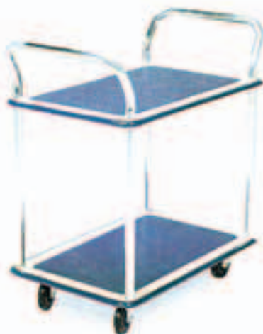
MOD. NB104 - NF304