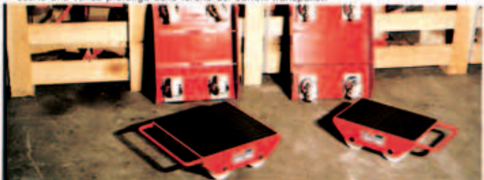
Mod. 1000R e 1000R4 per carichi eccezionali.