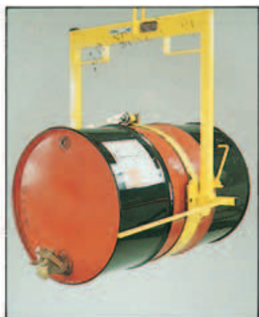
Mod. HY/DH1. Ribaltamento del fusto per gravità con freno meccanico per bloccaggio del fusto in posizione verticale o orizzontale.