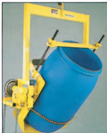
Mod. DTU/H/CRD/LC. Tipo idoneo per il ribaltamento di fusti in plastica con o senza coperchio. A richiesta versioni per fusti con diametro da mm. 270 a mm. 520.