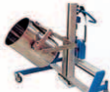
PRESA E RIBALTAMENTO FRON- TALE DI BIDONI O CONTENITORI