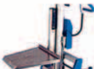
PIATTAFORME DI VARIE DIMENSIONI