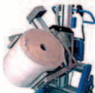
PRESA E RIBALTAMENTO BOBINE SUL DIAMETRO ESTERNO