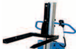
FORCHE FISSE O REGORABILI